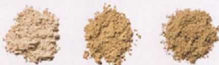
Слоновая кость 1 Слоновая кость 2 Бежевый 1

Mary Kay® Loose Powder, 21 g; цена 430 руб.